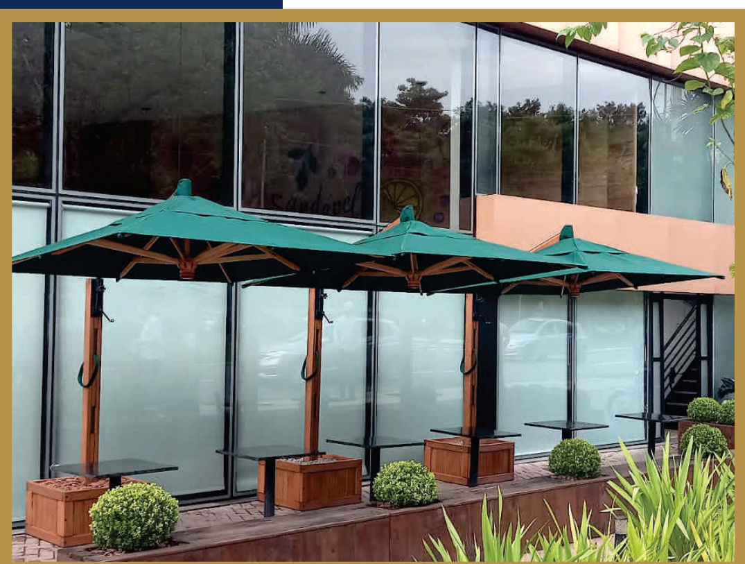
FRUTARIA SÃO PAULO