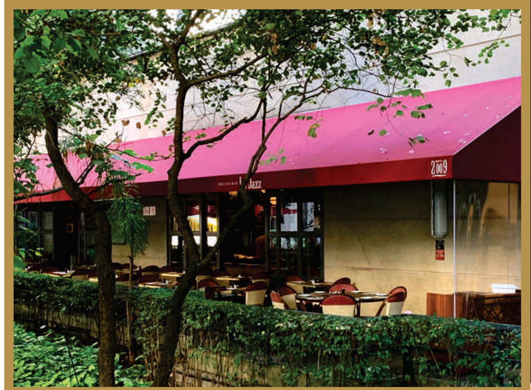
RESTAURANTE LE JAZZ