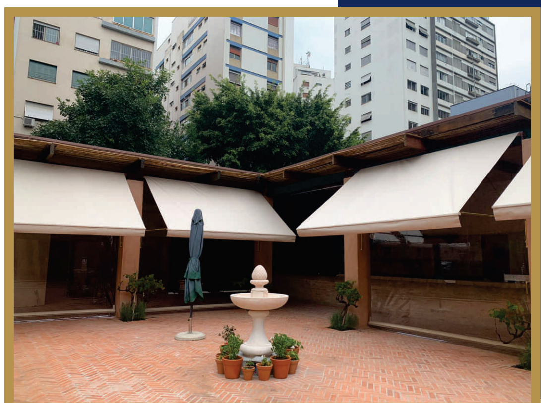
RESTAURANTE JARDIM DI NAPOLI