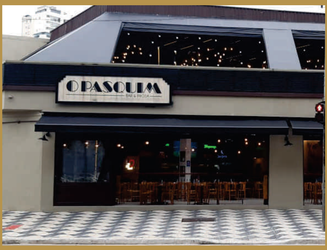
BAR O PASQUIM